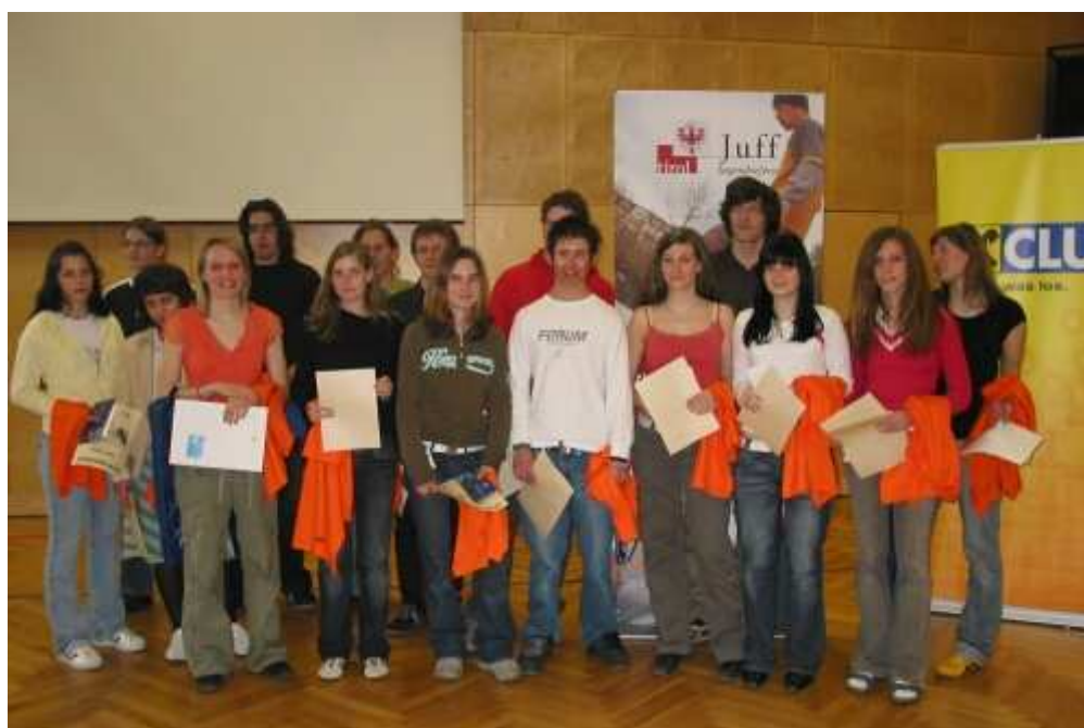
Gruppenfoto der Teilnehmer